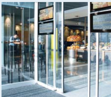
Der einladende Zugang.

Gemeinsam mit Ihnen analysieren wir die objektbezogene Situation. Kaba Gilgen unterstützt Sie bei der Planung und Ausführung der Mediatür.