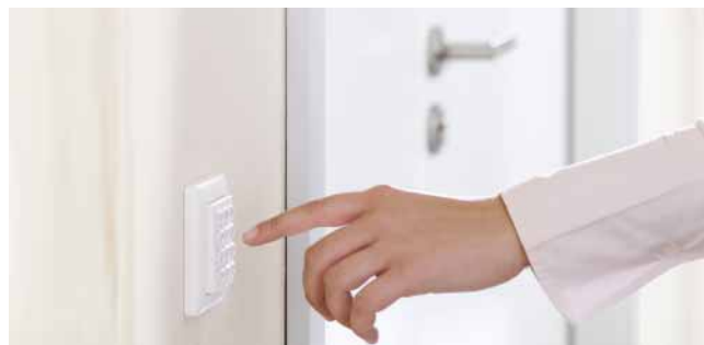
Sichere Zutrittskontrolle und einfache Bedienung: per Tastendruck.