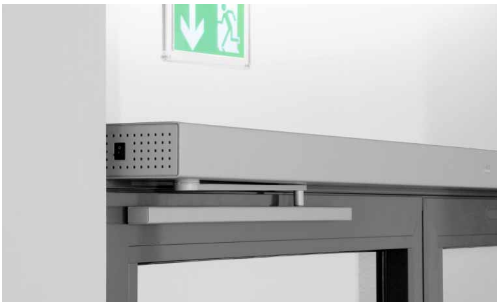
Professional: Nahtlose Verkleidung mit nur 70 mm Ansichtshöhe, für Profiltüren sehr gut geeignet.

Die mechanische Schließfolgeregelung ED ESR für zweiflügelige Türen arbeitet wartungsfrei und sorgt bei Türen mit Falz dafür, dass diese in der richtigen Reihenfolge schließen. Alle Komponenten des ED ESR sind unsichtbar unter der nur 70 mm hohen Abdeckung im DORMA Contur Design integriert.